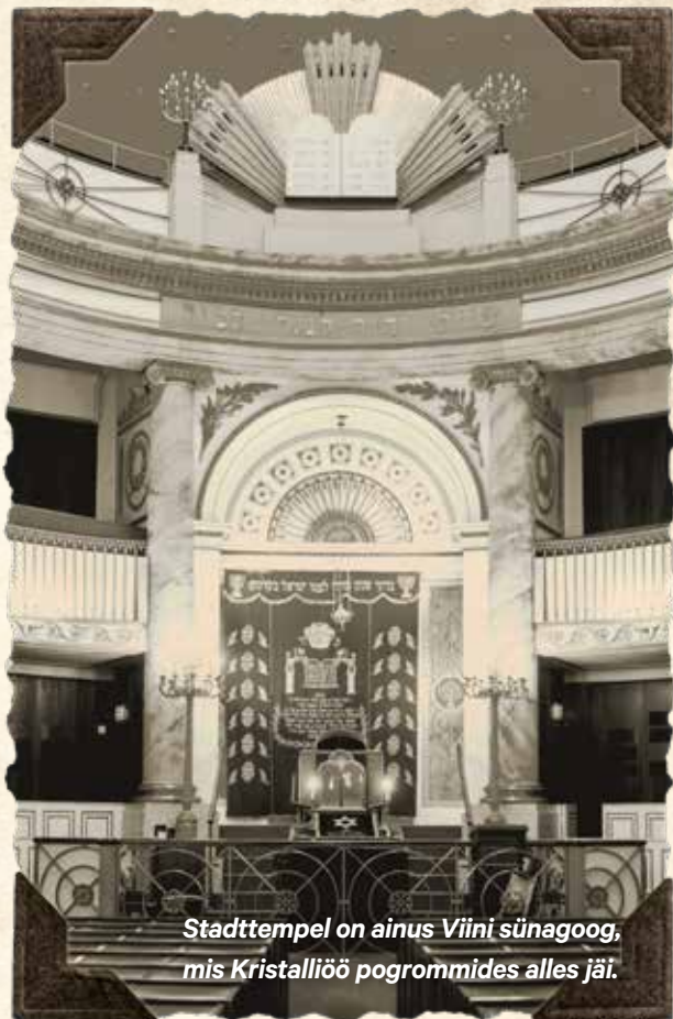
Stadttempel on ainus Viini sünaagoo, mis Kristalliöö pogrommides alles jäi.

Tänapäeva Austrias on nii kohalikest kui ka lisraelist sisse rännanud juutidest elanikkond taas kasvutrendis. Viini tuntuim juudi piirkond, kus asub enamik juudi asutusi, organisatsioone ja koššerrestorane, on Leopoldstadt.