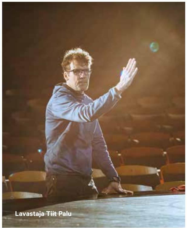
Lavastaja Tiit Palu