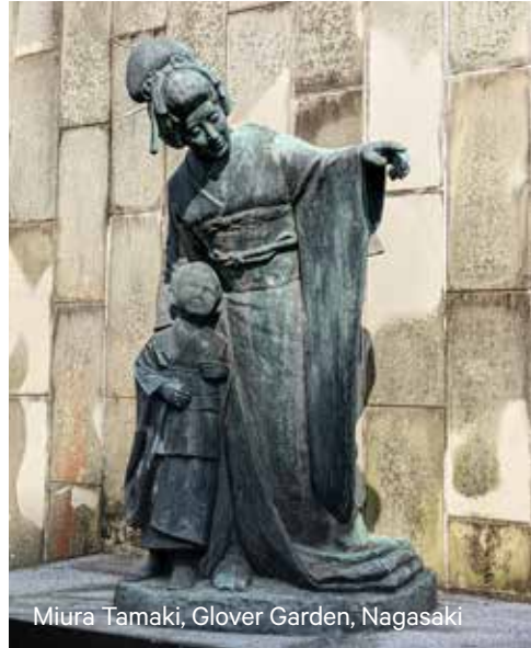
Miura Tamaki, Glover Garden, Nagasaki

Miura Tamaki oli esimene jaapanlanna, kes astus Chōchō-sani rollis üles aastal 1915.