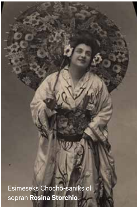
Esimeseks Chōchō-saniks oli sopran Rosina Storchio .

„Madama Butterfly” muutus üsna pea peale esietendust kaasaja üheks mängitavamaks ooperiks. Edu saladus seisneb liigutavas loos, mille taga peituv sotsiaalne konflikt on aktuaalne ka sajandi võrra hiljem.