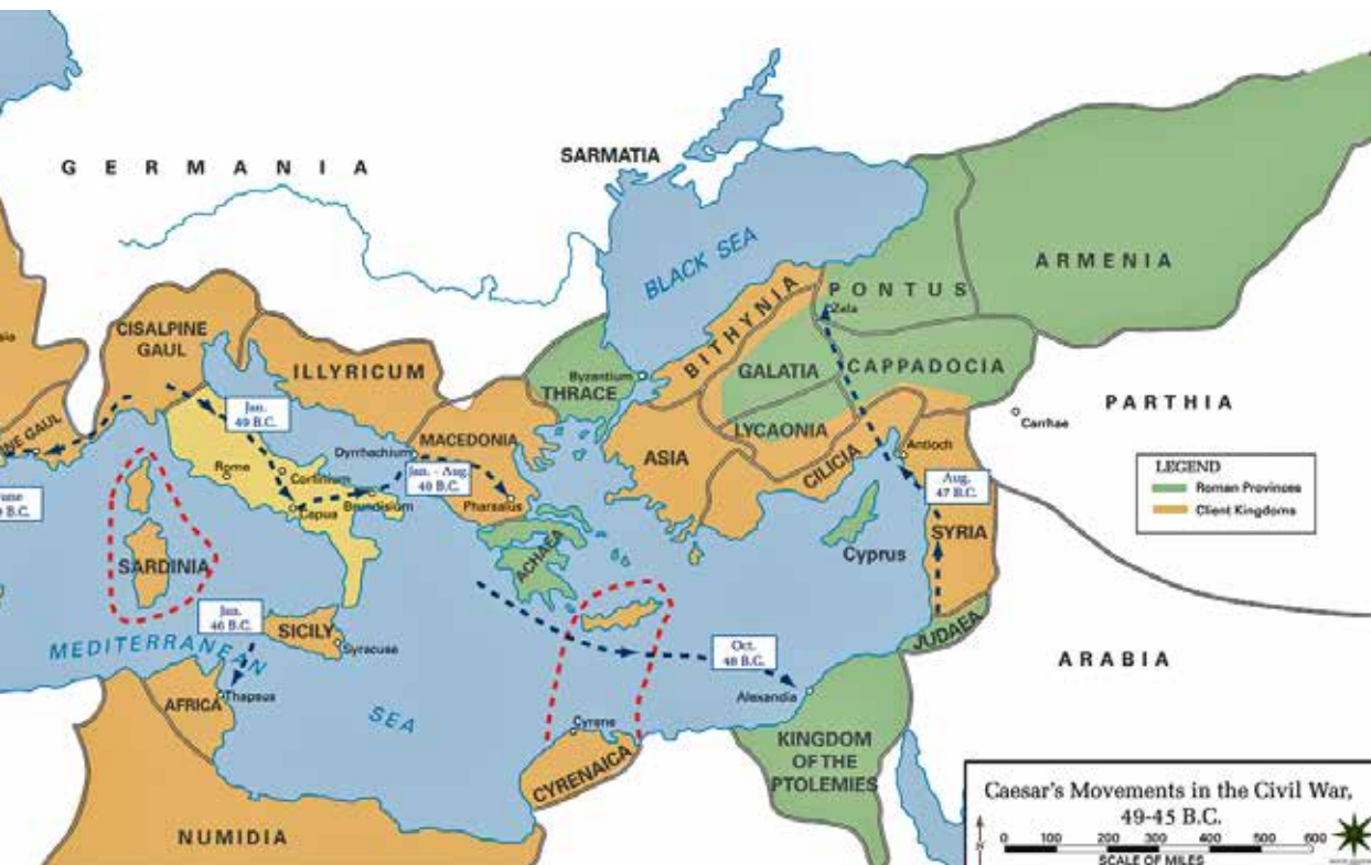
Rooma alade kaart 49-45 eKr kodusõja ajal

detsembris, et Caesar ja Pompeius peaksid üheaegselt kuberneriametist lahkuma, ent vaid päev hiljem pakuti Pompeiusele senati loata Itaalia vägede ülemjuhataja kohta, mille ta vastu võttis.