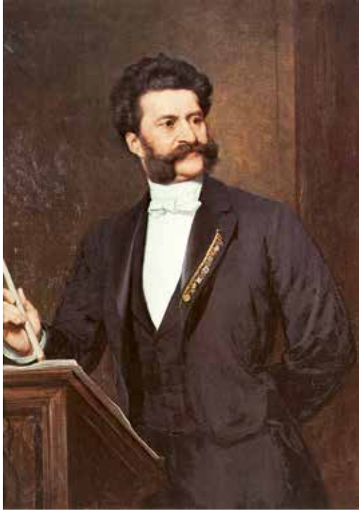
Autor: August Eisenmenger