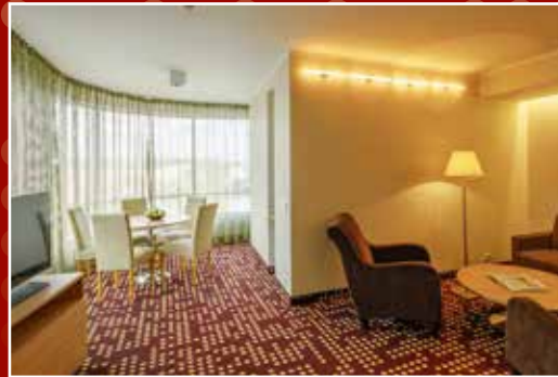
Hotell linna südames 205 mugavat tuba, suurepärane vaade ja rahulik miljöö