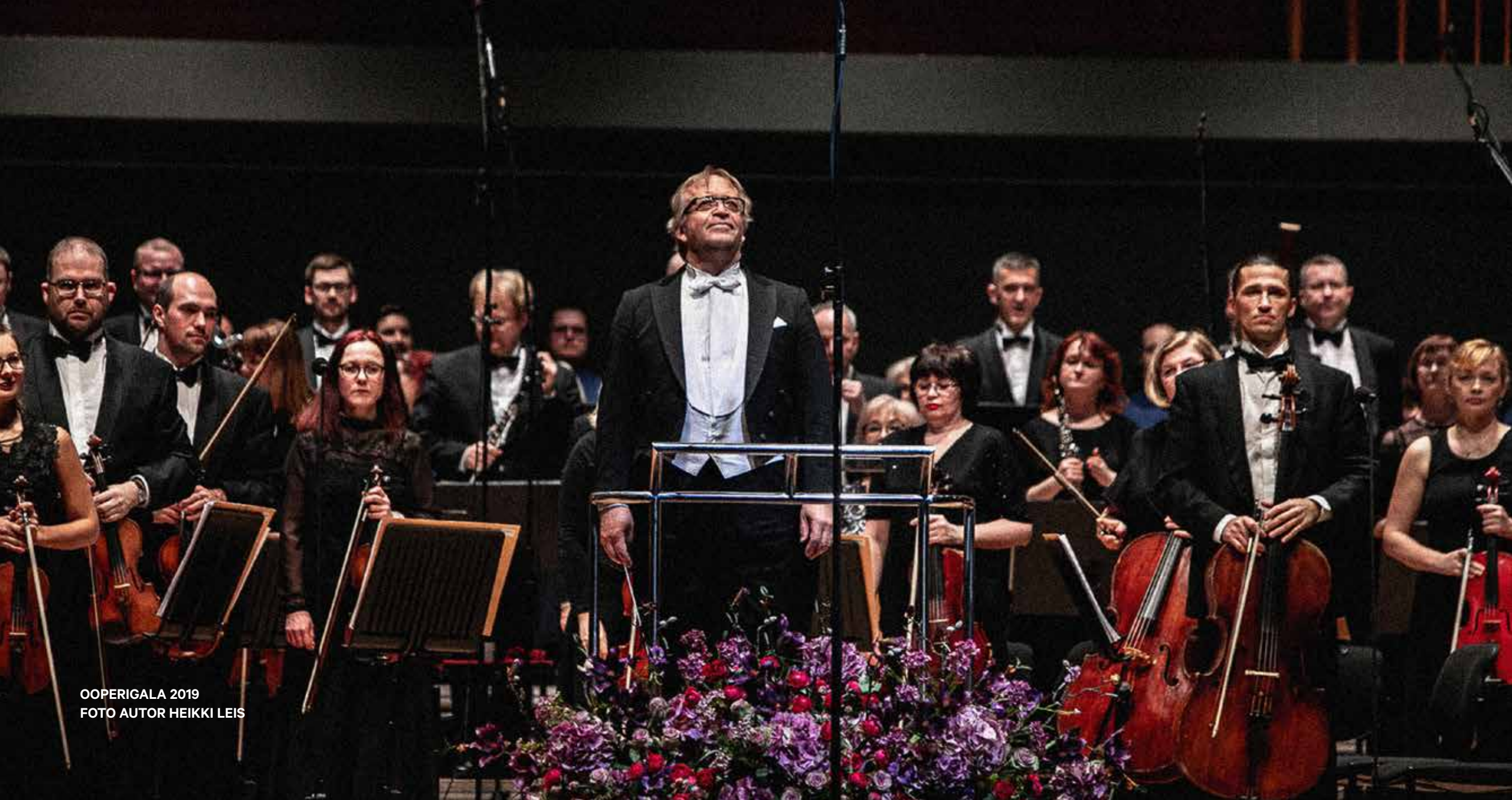
OOPERIGALA 2019