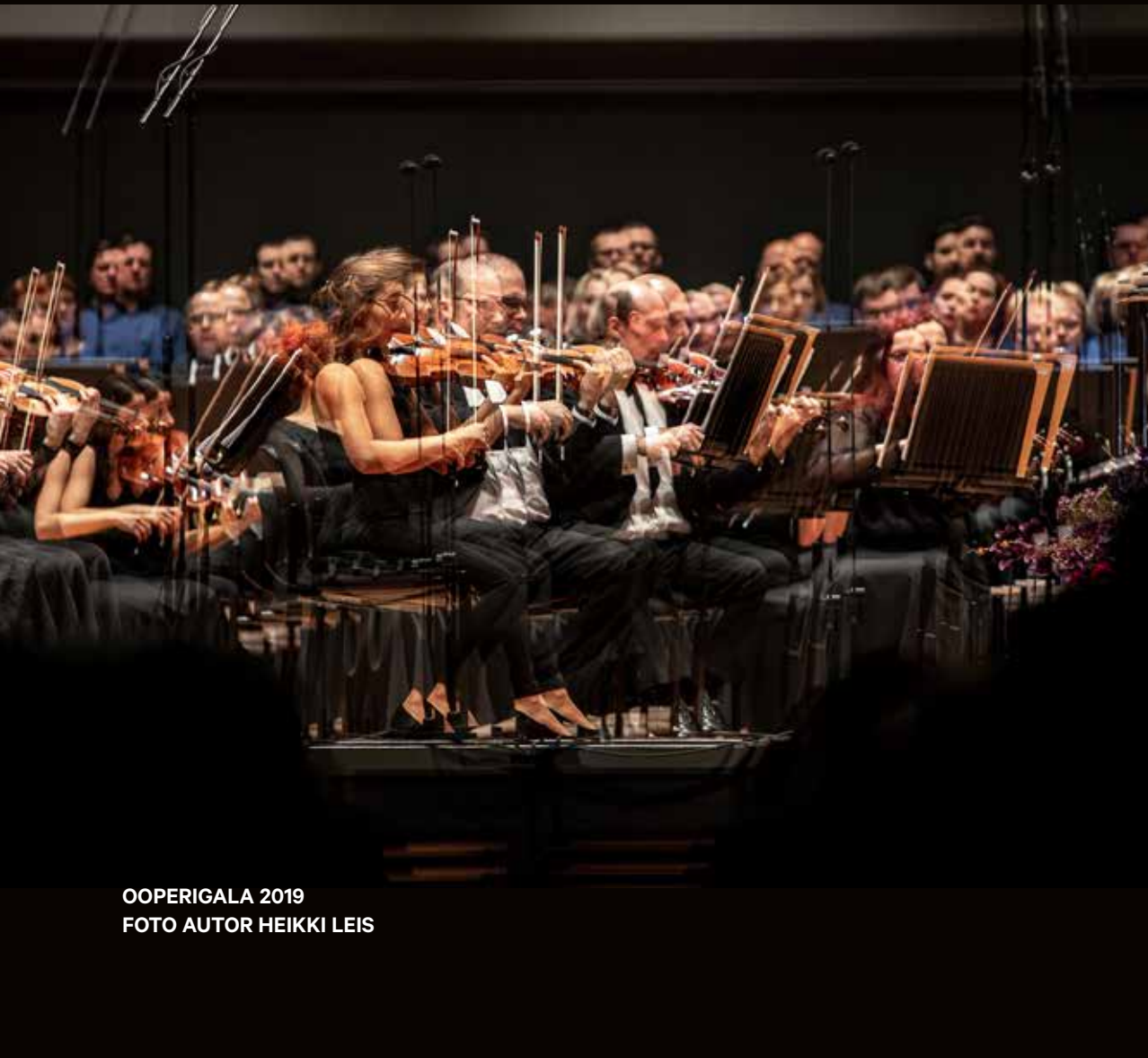
OOPERIGALA 2019