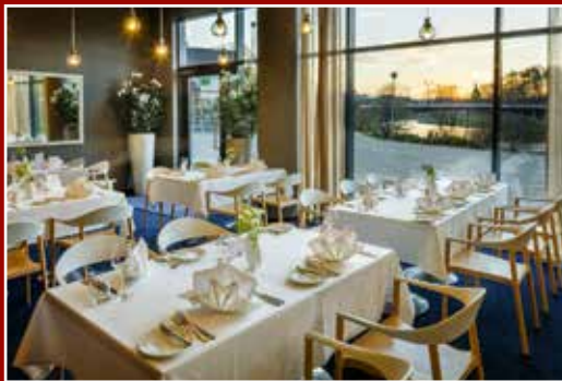
Restoran vaatega Emajõe Toiduelamused buffeest galaõhtusöögini