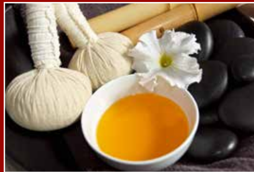
Spa Suur valik massaaže, spa- ja iluhoolduseid