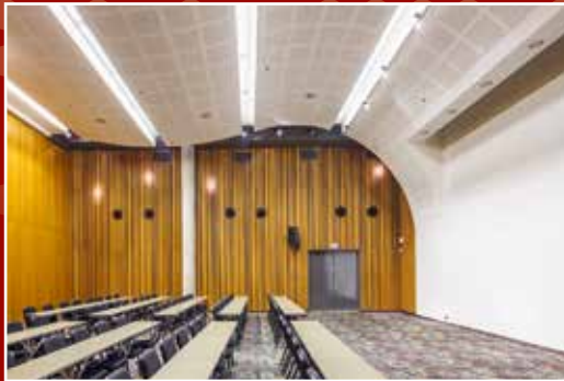
Konverentsi- ja peokeskus seminaridest pidulike bankettideni