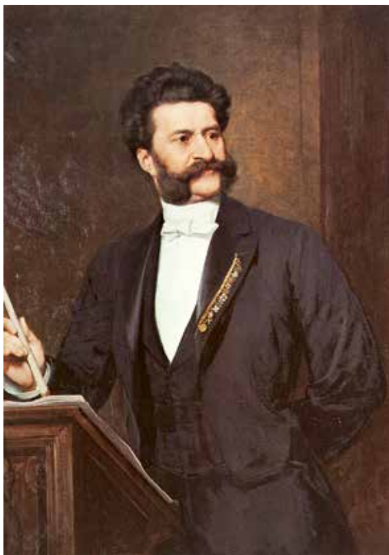
Autor: August Eisenmenger