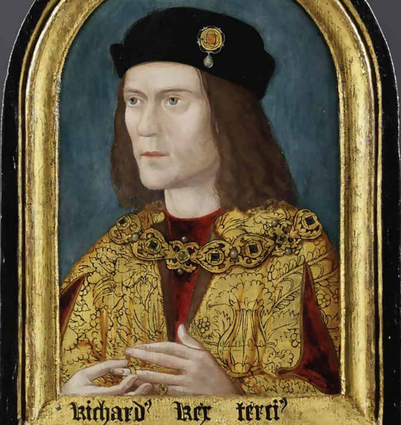
Richard 3 Rex terci 3