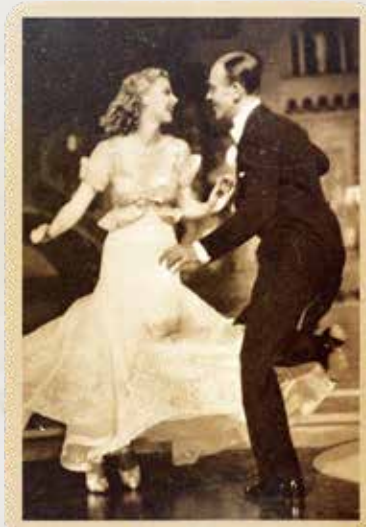
GINGER ROGERS JA FRED ASTAIRE

Muusikalitähed Fred Astaire ja Ginger Rogers olid klassikalise ajajärgu Hollywoodi ühed kõige populaarsemad ja tuntumad näitlejad. Paar oli väga edukas, tehes hulga filme nagu „Kõvakübar“ („Top Hat“, 1935), „Svingi aeg“ („Swing Time“, 1936) ja „Kas tantsime?“ („Shall We Dance“, 1937). Ka paljud draamanäitlejad osalesid hea meelega muusikalifilmides, et tuua oma tavapärase lavatüübi mängimisse vaheldust. Näiteks multitalent James Cagney , kes sai kuulsaks ka lavalaulja ja -tantsijana, kuid kelle pidevad n-ö kõva mehe rollid gangsterifilmides jätsid vähe võimalusi oma andeid näidata. Cagneyle Oscari toonud roll „Yankee Doodle Dandy's“ (1942) lubas tal laulda ja tantsida ning ta ise pidas seda rolli üheks oma suuremaks saavutuseks.