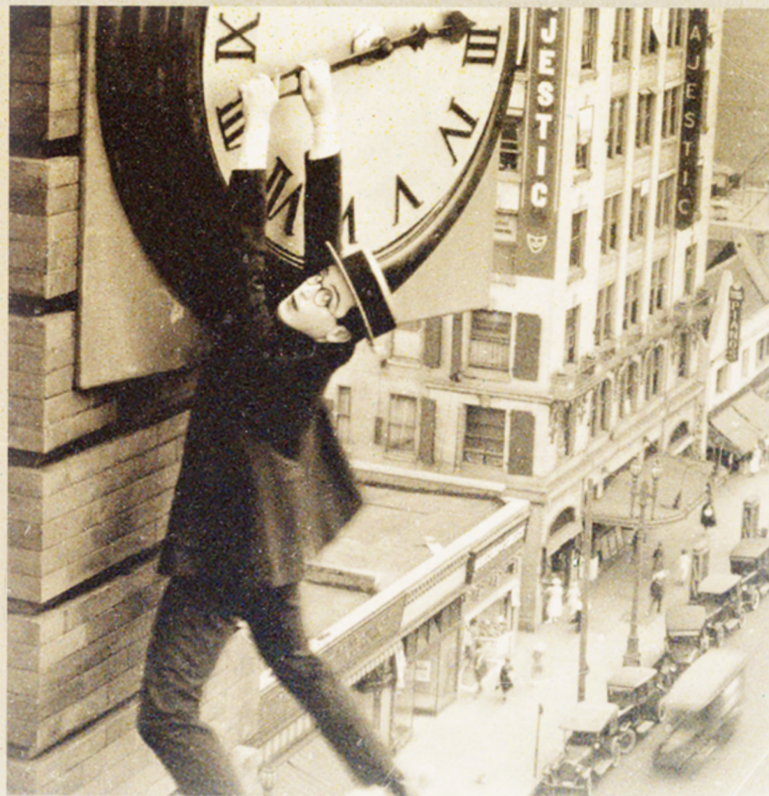
HAROLD LLOYD, STSEEN FILMIST „SAFETY LAST”

„Prillipapast“ tummfilmikoomik Harold Lloyd asub filmiajaaloos võrdsena kõrvuti nii Chaplini kui Keatoniga. Oma kõige kuulsamas tummfilmis „Lõpuks ometi pääsenud!” („Safety Last”, 1923) ripub ta linnamaja seinale kinnitatud kella küljes.