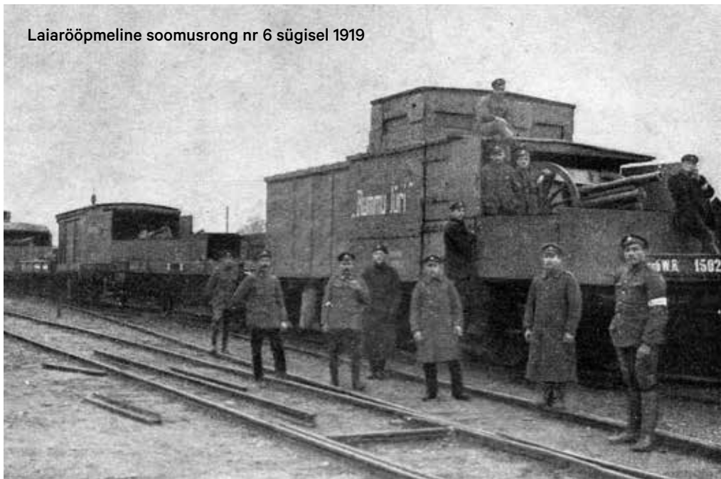
Laiarööpmeline soomusrong nr 6 sügisel 1919

„Vaadake, poisid!” hüüdis korruga Käsper ja näitas käega vasakule.