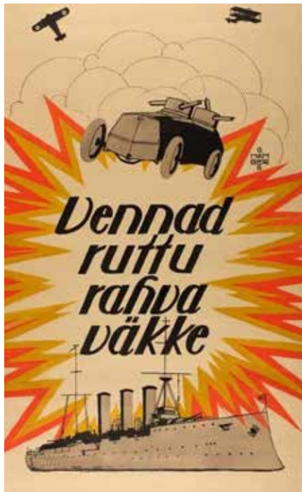
Eesti esimene sõjaplakat „Vennad ruttu rahvaväkke” (1918)

Mati Õun, „Eesti Vabariigi soomusvägi 1918–1941”, Grenader, 2017