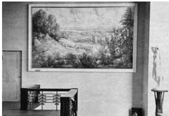
A. Vardi Otepää maastik 1939