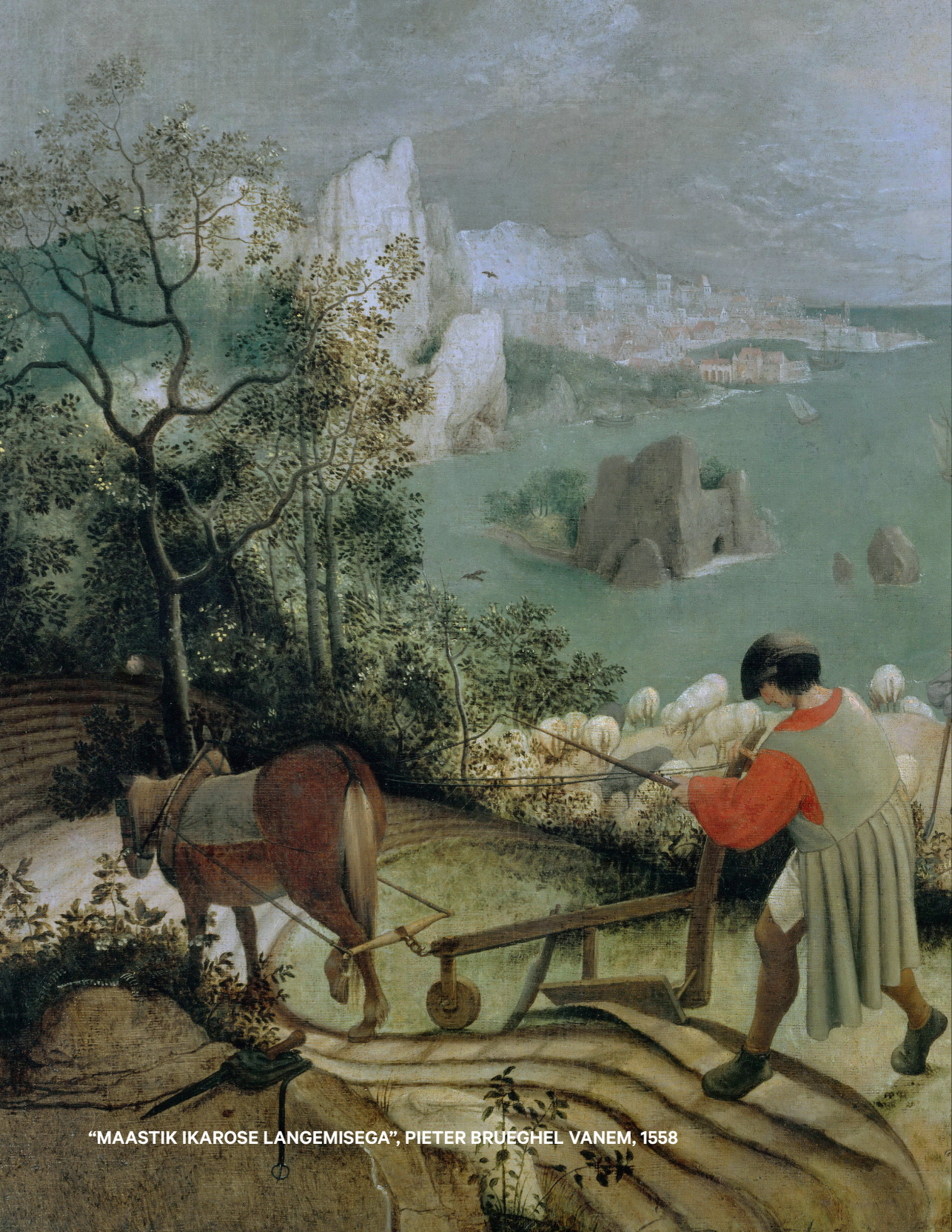
“MAASTIK IKAROSE LANGEMISEGA”, PIETER BRUEGHEL VANEM, 1568