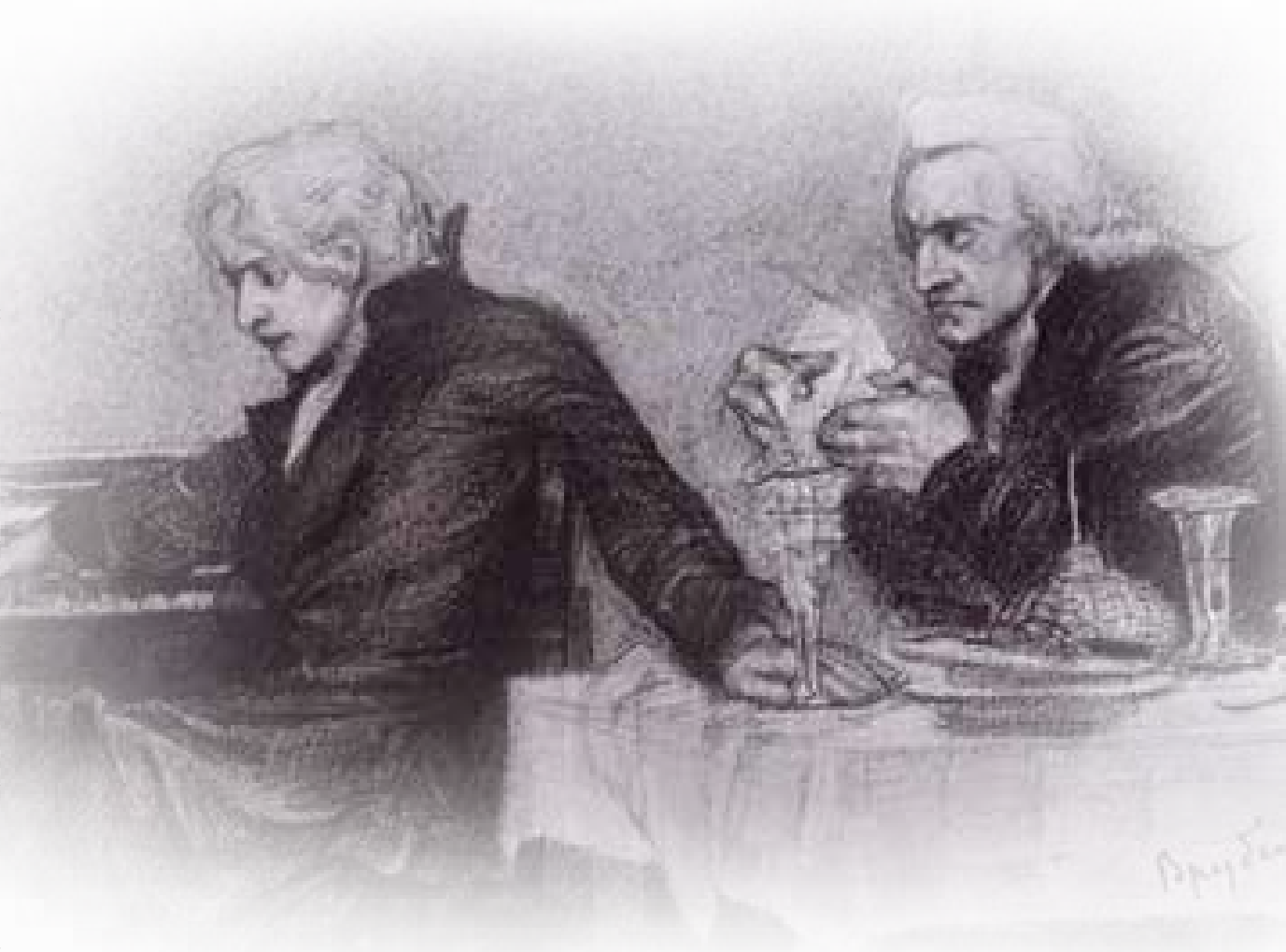
SALIERI VALAB MOZARTI KLAASI MÜRKI — MIHHAIL VRUBEL 1884

Kokkuvõttes on Rimski-Korsakovi „Mozart ja Salieri”, sarnaselt seda inspireerinud Puškini poeemdraamaga, eksperiment. Puškin nimetas „Mozarti ja Salieri” esialgu „draamauurimuseks”, mis ei olnud mõeldud lavastamiseks, ega andma vastust keerulisele küsimusele geniaalsuse ja kuritahtlikkuse ühtesobimatusest. Ooperi edu ja originaalsus paistab toetavat vastuolulist oletust, et kunstnikud loovad huvitavaimad tööd just siis, kui nad ei arvesta teose võimaliku publikuga.